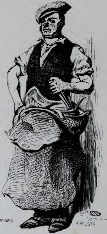
Le Maréchal ferrant.